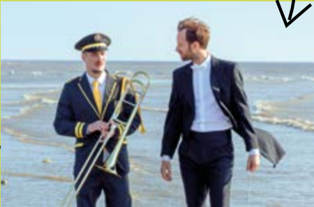
© 2023 - Agat Films - France 2 Cinéma

➤ Studio 43 Tarif : 7,50 €, 5 €, 4,50 €. Tél. 03 28 66 47 89. www.studio43.fr.