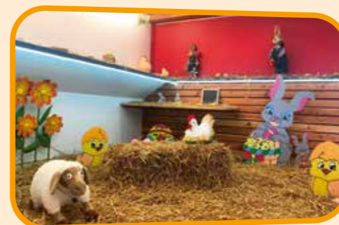
↑ Le hall de la mairie attend petits et grands pour de jolies photos.

Sur le parvis Nelson Mandela, un enclos de jolies décorations en bois (œufs, poussins, poules, lapins...), toutes réalisées par nos Services Techniques, a été installé. Si vous le souhaitez, vous pouvez venir avec vos enfants ou petits-enfants faire des photos devant ce décor aux couleurs printanières. Dans le hall, les services communaux ont installé un décor champêtre pour apporter une touche de gaieté qui est la bienvenue en cette période si particulière. Vous pouvez venir visiter, aux horaires d'ouverture de la mairie, et ce jusque fin avril. Vous serez les bienvenus !