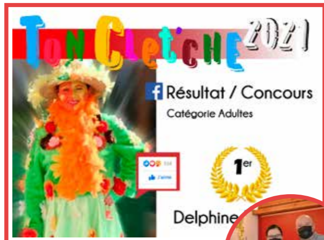
↑ Delphine FERMYN catégorie adulte