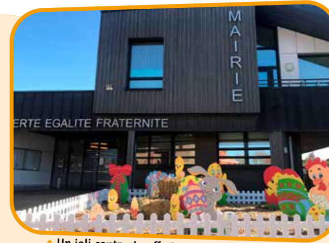
↑ Un joli contraste offert par cette ferme en plein coeur de ville.