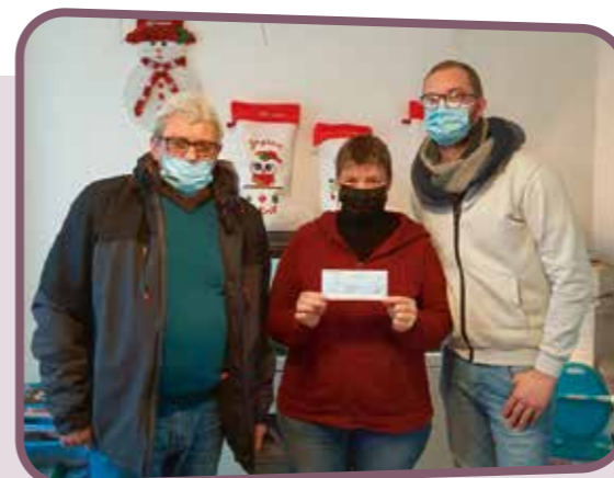
↑ Un don qui facilitera les activités de l'APE Jean Jaurès

Chaque année, l'association le Bon Pointeur Fort-Mardyckois fait un don à une association pour favoriser la mise en œuvre de ses actions. En 2020, un don de plus de 600€ avait été effectué pour le Téléthon. Cette année, c'est à l'APE Jean Jaurès que le Bon Pointeur a fait un don de 400€ pour aider à la réalisation des projets en faveur des enfants fréquentant l'école Jean Jaurès. Merci à eux pour ce geste solidaire !