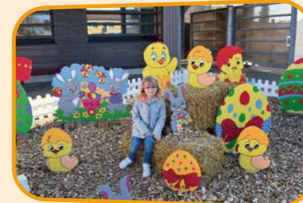
↑ Les enfants posent pour une photo souvenir.