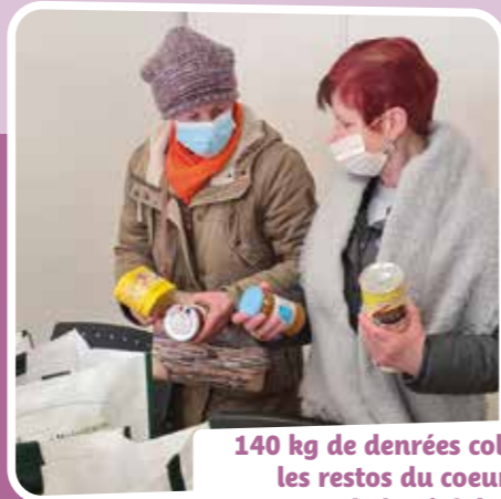
140 kg de denrées collectés pour les restos du coeur grâce à la générosité des habitants