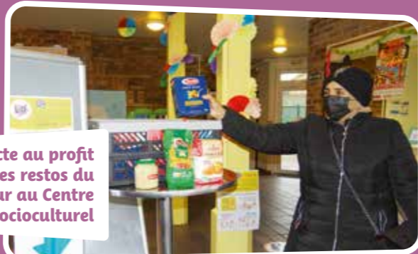
Collecte au profit des restos du coeur au Centre Socioculturel