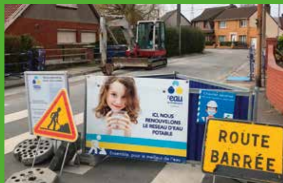
↑ Renouvellement de canalisations d'eau potable dans certaines rues de la commune.

Des travaux de renouvellement d'une canalisation d'eau potable sont en cours depuis la fin février et jusque mi-avril dans la rue du Flot Moulin, la rue Félix Faure et la rue de la Plage. Réalisés en partenariat entre l'Eau du Dunkerquois et les sociétés SUEZ et SADE, ces travaux sont matérialisés par un panneau de chantier situé à chaque extrémité de la zone du chantier, la circulation est interdite aux véhicules de 8h à 17h (sauf riverains) et les poids lourds sont déviés par la rue de la plage.