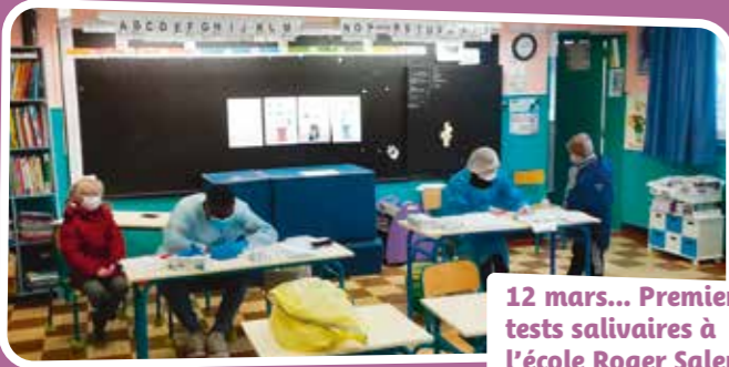
12 mars... Premiers tests salivaires à l'école Roger Salengro