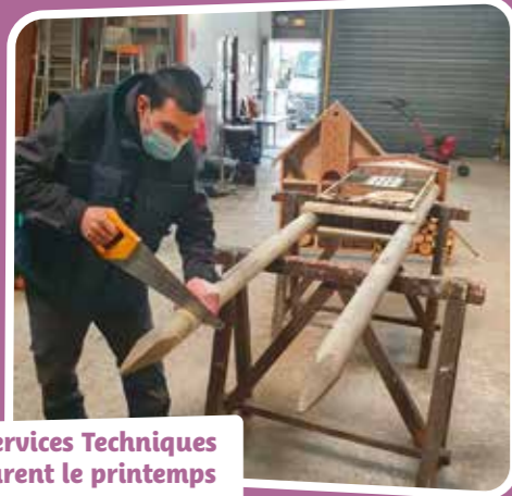
Les Services Techniques préparent le printemps