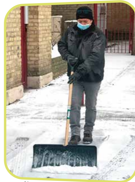
↑ Nos services en action pour la mobilité de tous.

Rappelons que les riverains ont pour obligation de déneiger leur portion de trottoir et de saler ou sabler en cas de verglas. En cas de chute ou d'accident, ils en seraient