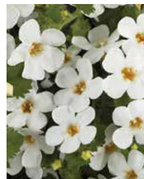
↑ Bacopa guliver white.