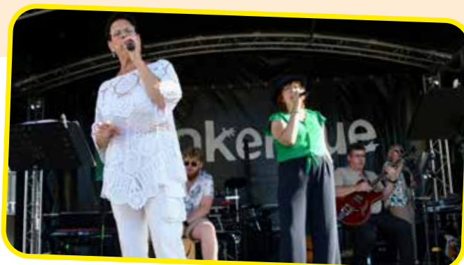
↑ Le groupe Ames Né Zik animait la 1 ère partie de soirée.