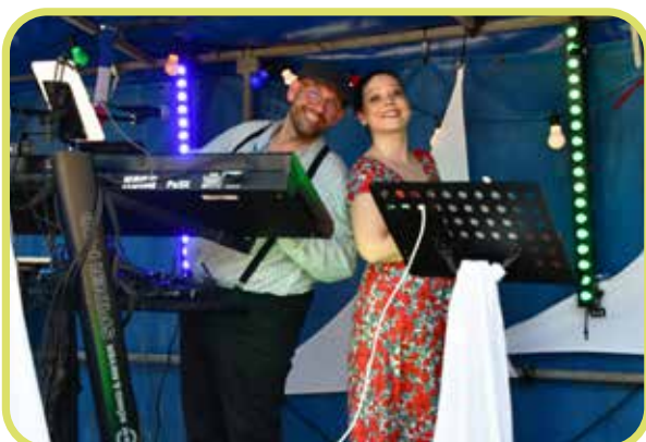
↑ Le duo Cart'Noire animait cet après-midi festif.