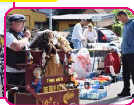
↑ Un air de musique qui apporte de la bonne humeur !