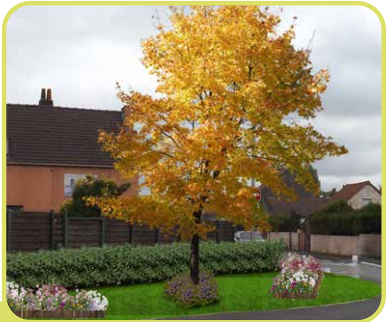
↑ Projection paysagère à l'angle des rues Général De Gaulle et Amirauté.

Ainsi, un nouvel îlot de fleurissement va prochainement voir le jour à l'angle des rues de l'Amirauté et du Général De Gaulle . La CUD prendra en charge les travaux de voirie et la commune se chargera d'effectuer les plantations dans cet espace. L'arbre qui sera planté au centre de la zone est un Ginkgo Biloba.