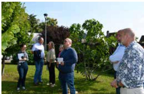
↑ Faire reconnaître le caractère fleuri mais surtout durable de la commune

Avec le retour de la nature en ville comme l'un des projets phare de ce mandat, la commune a pour ambition de décrocher la première fleur dans le label des « Villes et Villages fleuris ».