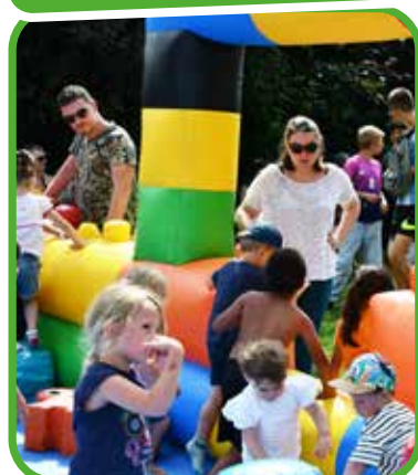
↑ Au Square des Enfants, la fête est familiale.