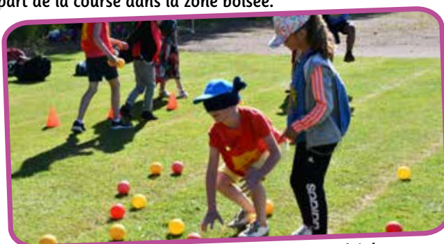
↑ Un duo nécessaire pour le parcours de cécité.