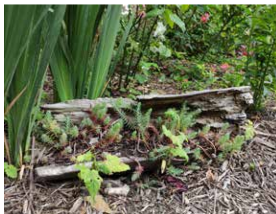
↑ Une belle façon de recycler un déchet vert !

La commune vous propose de participer à une rencontre sous forme de question/réponse sur la thématique des biodéchets. Celle-ci aura lieu le 7 novembre, en salle des actes en mairie, de 17h30 à 19h00. Thomas DEVYS du CPIE Flandre Maritime répondra aux questions.