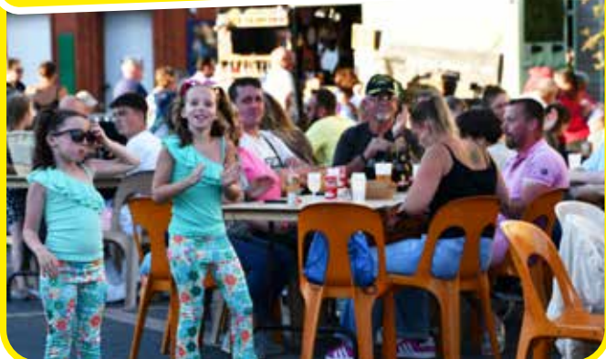
↑ Un public de tous âges !