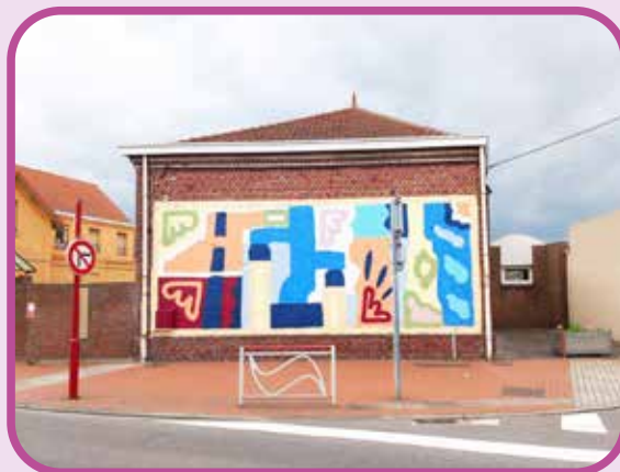
↑ Mise en couleur artistique du pignon de l'école de l'Amirauté.

Merci au CIAC et à OBSIK pour cette réalisation qui amène l'art urbain dans notre commune.