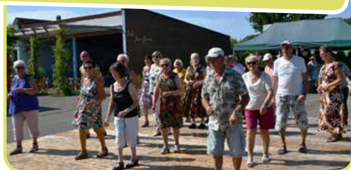
↑ La piste de danse n'a pas désempilé !