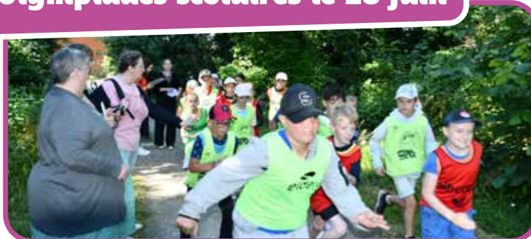
↑ Départ de la course dans la zone boisée.