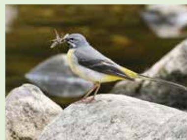
↑ Bergeronnette des ruisseaux, photo de Sonia Johnson.

L'une des espèces observées est la Bergeronnette des ruisseaux : passereau très dépendant de l'eau, surtout des eaux courantes. Aperçue à proximité de Bio-Topia, cette espèce est probablement intéressée par les mares du zoo. Elle peut mesurer 19 cm de long pour un poids de 18g.