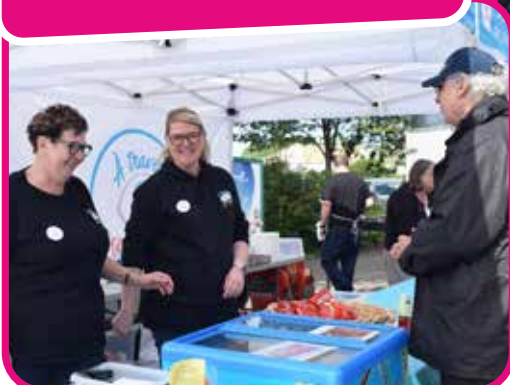
↑ L'association A travers ton regard organisait la brocante du 25 août.