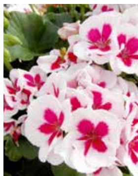
↑ Pelargonium white splash.

Comme chaque année, la commune a distribué des plants durant la semaine du 27 mai à une cinquantaine d'habitants afin de fleurir la jardinière communale mise à disposition. Lors de cette édition, étaient proposées des plantes annuelles (Pelargonium white splash et Bacopa guliver white). Ces plantes nécessitent peu d'arrosage et constituent de très jolies plantes d'ornement.