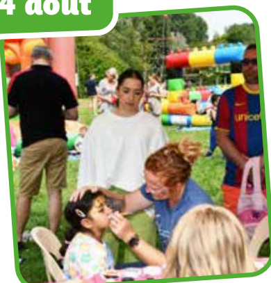
↑ Le stand maquillage pour être beau ou belle pour la fête.