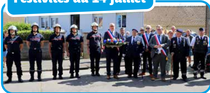
↑ Commémoration du 14 juillet.