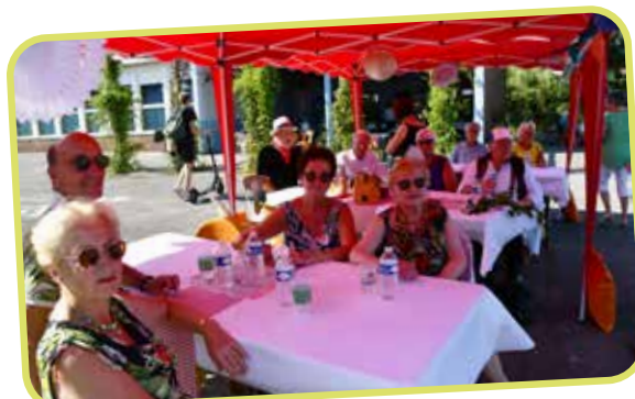
↑ A l'ombre des tonnelles, une pause bien méritée pour se rafraîchir.