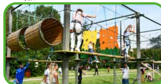
↑ Les plus aventureux se risquent à l'accrobranche.