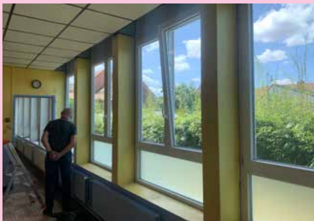
↑ Un bardage a été installé au bâtiment mixte du groupe scolaire Jean Jaurès.

Enfin L'Espace Enfance Famille n'est pas en reste. L'agrandissement du dortoir et le remplacement de la chaudière ont représenté une dépense de 16 500€.