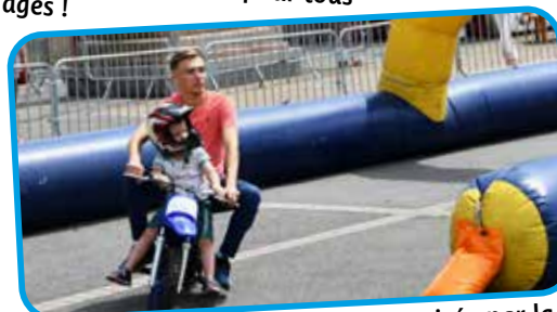
↑ Initiation à la mini moto organisée par la TEAM DK STUNT.