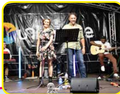
← Ce sont les 8&MORE qui ont clôturé cette belle soirée d'août.