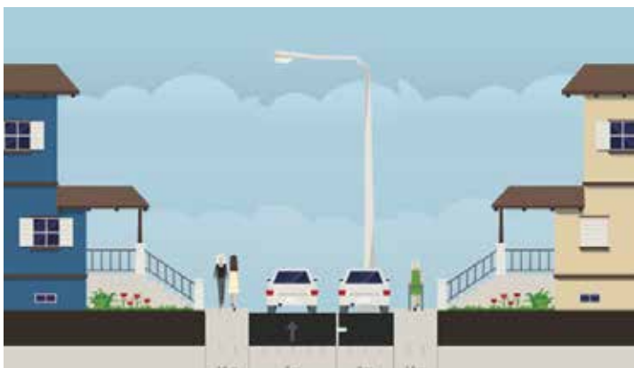
↑ Projection de la rue Sadi Carnot après travaux.