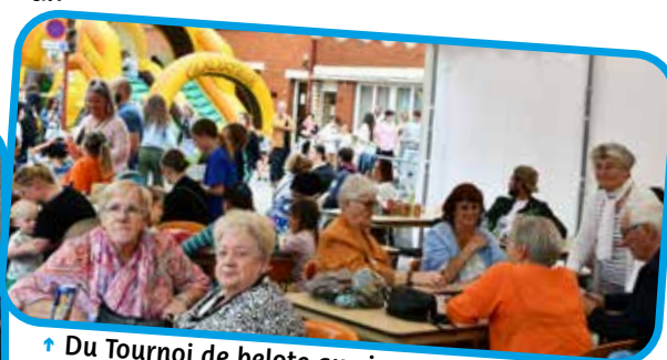
↑ Du Tournoi de belote aux jeux gonflables, il y en avait pour tous les âges !