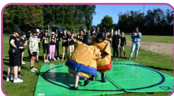
↑ Un combat en costume de Sumo très suivi par tous les écoliers.