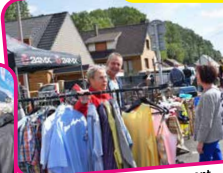
↑ Les rues de la commune se sont animées sous le soleil.