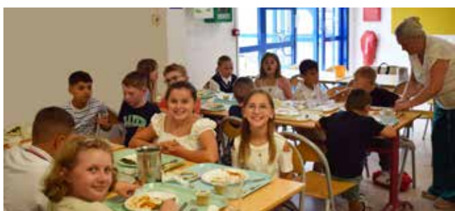
↑ De la bonne humeur à table à la cantine Gaston BORNAIS.

La commune poursuit son travail avec la ville de Dunkerque pour proposer aux enfants des repas dont les maîtres mots sont qualité, équilibre et diversité dans le respect des règles nutritionnelles en vigueur. La « commission menus » attache également une attention particulière au plaisir des enfants avec un menu exceptionnel avant chaque période de vacances.