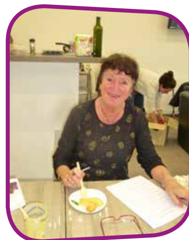
↑ Cuisiner avec des huiles essentielles, une nouveauté !

Ces aliments ont été sublimes, et l'atelier s'est terminé par la dégustation d'un velouté de carottes et coco, de biscuits au fromage de chèvre et au thym, d'un fondant au chocolat et à la menthe poivrée, ainsi que d'une poire cuite à la vapeur et aromatisée à la bergamote.