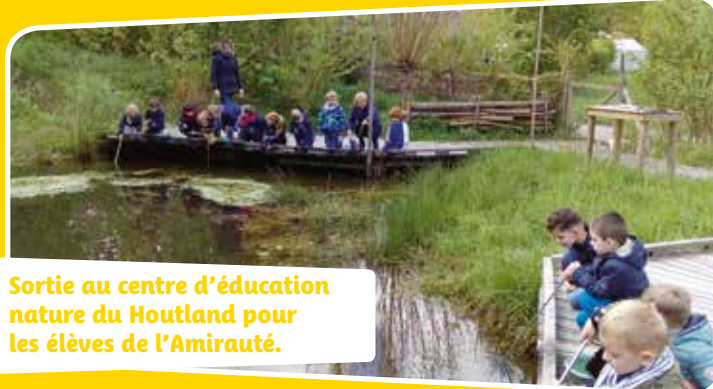
Sortie au centre d'éducation nature du Houtland pour les élèves de l'Amirauté.