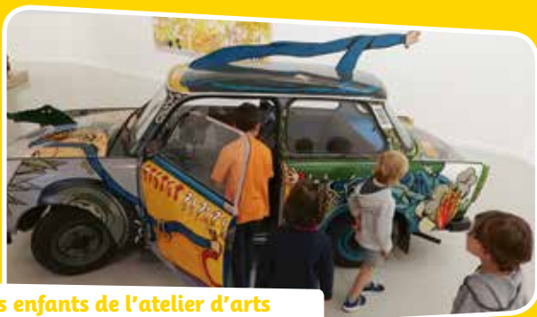
Les enfants de l'atelier d'arts plastiques en visite au LAAC.