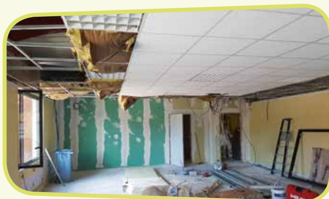
↑ Du sol au plafond, la rénovation avance à bon train.