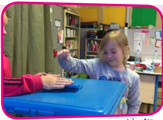
↑ Les CE2 de nos écoles apprennent à voter comme les grands !

Le jeudi 20 et le lundi 24 juin, les élèves de CE2 des écoles Roger Salengro et Jean Jaurès ont été appelés à élire leurs représentants au sein du Conseil municipal d'Enfants.