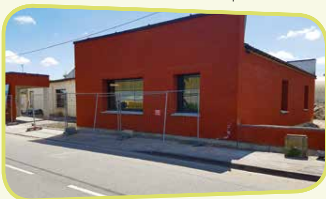
↑ Avec l'extension, le bâtiment a complètement changé d'allure.

extérieurs nécessaires au passage des réseaux d'eau, d'électricité et de téléphonie sont en cours de réalisation. Une fois les travaux achevés, cet équipement pourra accueillir les élèves de l'école d'arts plastiques et l'atelier municipal Arc en ciel.