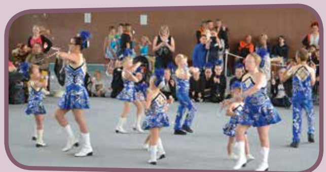
↑ De belles chorégraphies ont été proposées au public.

L'Étoile du marin a organisé son festival de majorettes le dimanche 9 juin à la Salle des sports. Des groupes venus de toute la région ont répondu à l'appel et ont offert aux nombreux visiteurs un spectacle de grande qualité. Du côté de la compétition, c'est le club de Sainte-Marie-Kerque qui s'est imposé dans la catégorie des "petites" suivi des danseuses de Craywick et en 3 ème position, on retrouve le club Aubépine de Gravelines. Chez les moyennes, dans la catégorie "parade" c'est le groupe de Valenciennes qui s'est classé 1 er suivi de Sainte-Marie-Kerque et de Wallers en 3 ème place. Dans la catégorie "twirling", les magnolias de Calais se sont imposées et le club d'Ardres est arrivé en 2 nde position. Enfin, pour ce qui est du classement chez les grandes, on retrouve Valenciennes 1 er , Brouckerque 2 nde et Hérin 3 ème en catégorie "parade" alors que dans la catégorie "twirling", les Magnolias de Calais se sont classées 1 ères suivies des danseuses d'Ardres. Ce sont