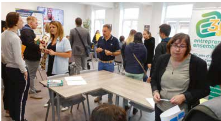
↑ De nombreux jeunes intéressés par cet événement.

Les témoignages recueillis auprès des visiteurs et des intervenants parlent d'eux-mêmes :