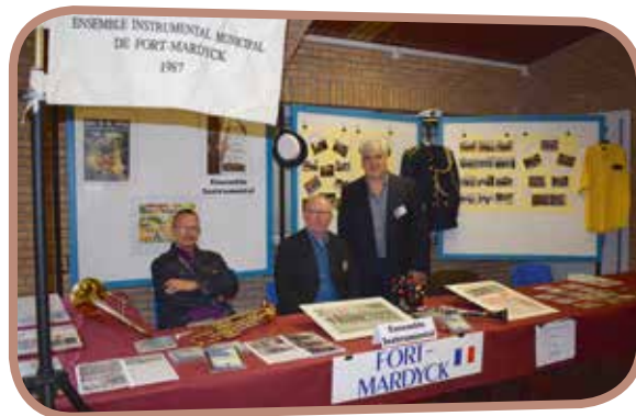
↑ Forum associatif est une vitrine pour les associations.

Le samedi 14 septembre, les membres des associations seront conviés au séminaire des associations . Deux ateliers animés avec le concours de l'URACEN leur seront proposés. Dans le courant de la semaine, seront également au programme : une conférence débat au centre socioculturel et un après-midi handi-pétanque organisé en partenariat avec le Foyer des Salines et des Papillons Blancs. Le mercredi 18 septembre une rencontre intergénérationnelle ouverte à tous aura lieu de 14h à 17h au centre socioculturel. Au programme : activité de création de blasons, jeu Feelings (travail sur les émotions, l'empathie, le respect des autres), jeu de la pelote de laine dans lequel les participants doivent se relier les uns aux autres avec une pelote de laine en fonction de leurs points communs.