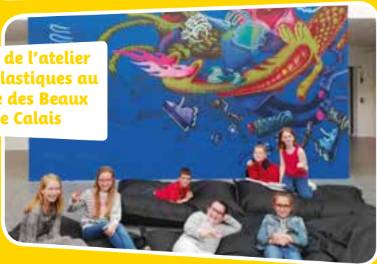
Sortie de l'atelier Arts plastiques au Musée des Beaux Arts de Calais