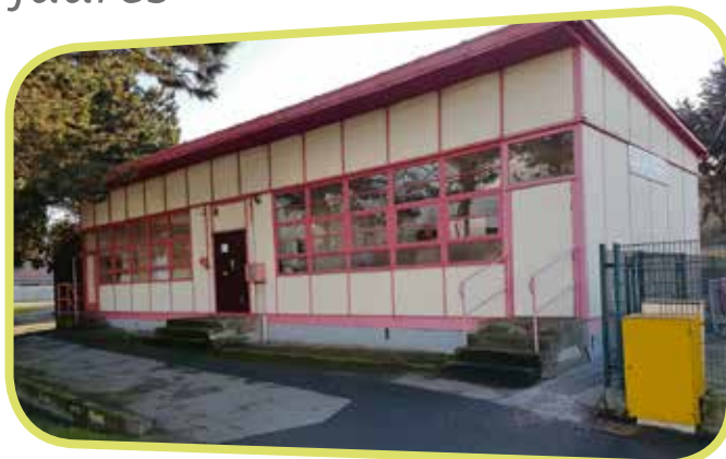
↑ L'ancien local arts plastiques avant travaux.

Tout est mis en œuvre pour que les enfants aient de bonnes conditions de travail à la rentrée prochaine.