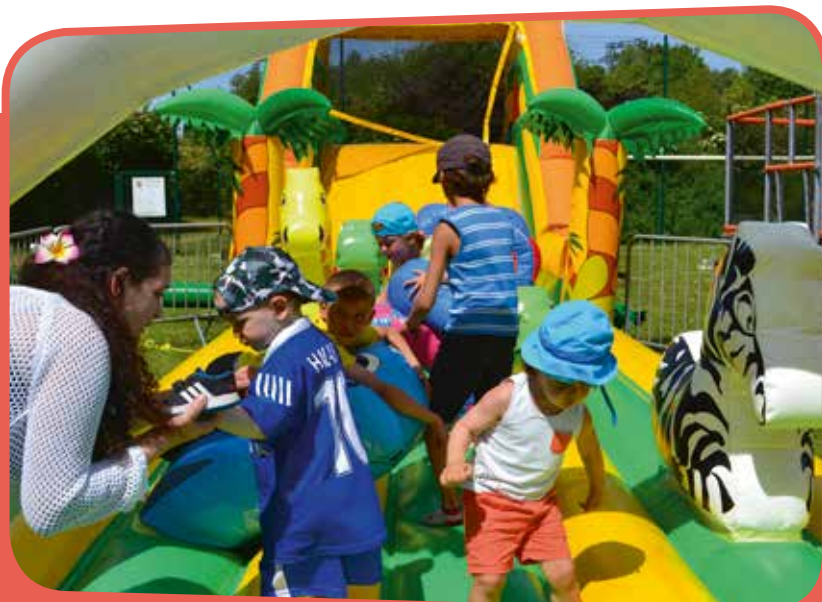
↑ Le City était en fête pour le plaisir des enfants et des parents !