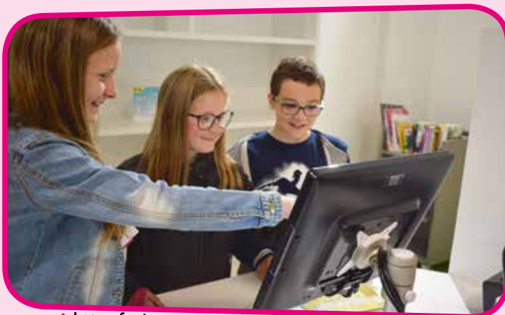
↑ Les enfants apprennent à se servir des bornes de retrait des livres.

Le 29 mai, direction la nouvelle bibliothèque de Dunkerque pour une visite guidée de ce formidable équipement culturel qui propose outre des livres, des CD, des partitions, des magazines et des DVD. Beaucoup de jeunes viennent s'y documenter et travailler dans des salles spécialement aménagées à cet effet. La BIB est également un espace ludique où l'on peut pratiquer le piano, écouter de la musique, surfer sur le web, regarder la télé, ou s'amuser aux jeux de vidéo. Les enfants qui n'étaient pas encore inscrits ont pu le faire. C'est un espace de rencontres, d'échanges,