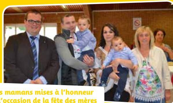
Les mamans mises à l'honneur à l'occasion de la fête des mères