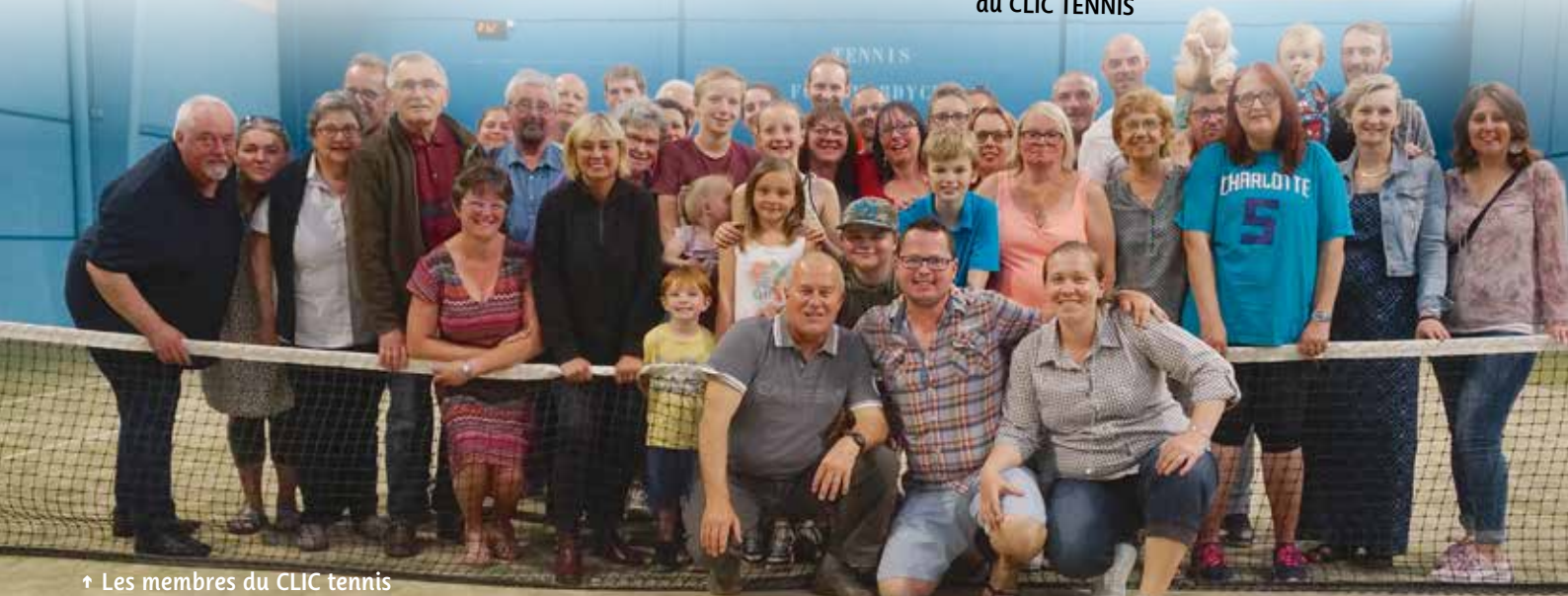
↑ Les membres du CLIC tennis