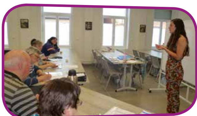
↑ Une action d'information sur la santé très appréciée des participants

L'objectif de l'Association PREVAL (Prévention Vasculaire Littoral Flandre) est d'améliorer la qualité de la prise en charge éducative des personnes atteintes de diabète et de risques cardio-vasculaires en instaurant des changements de comportement durables.