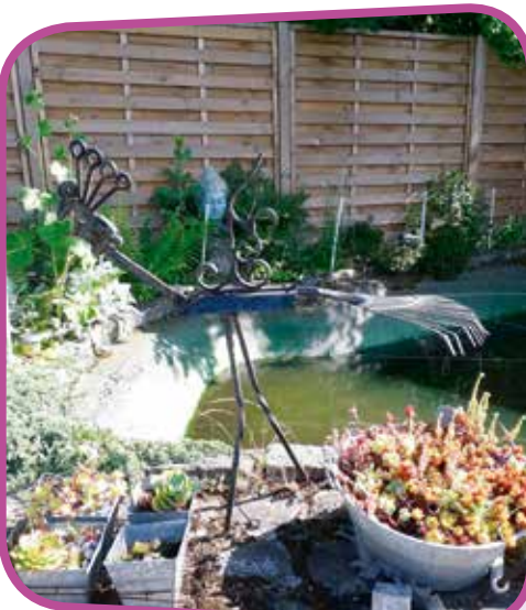
↑ Sculpture à base de vieux outils selon Pascal VANHOVE.