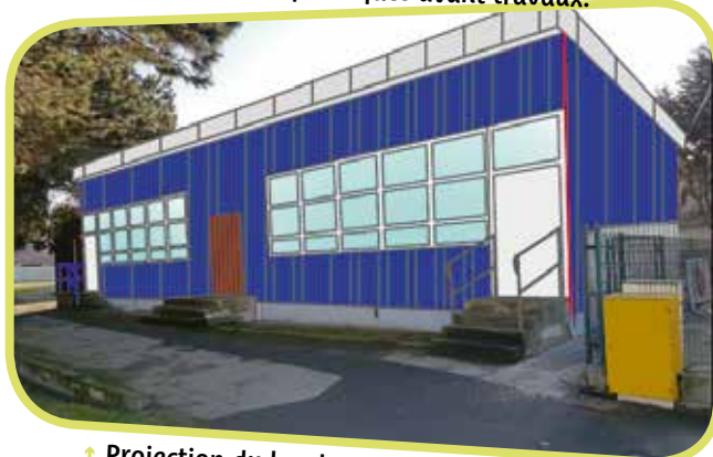
↑ Projection du local arts plastiques après travaux.