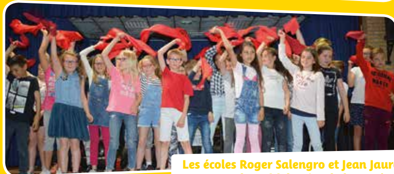
Les écoles Roger Salengro et Jean Jaurès ont chanté à la Fête de la musique