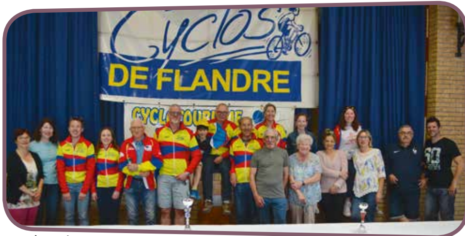
↑ Le cyclotourisme de Fort-Mardyck a organisé une belle randonnée du kangourou

C'est par une météo favorable que les 281 participants à la randonnée du Kangourou se sont lancés sur les différents parcours proposés par le Club cyclo de Fort-Mardyck. En effet, ce dimanche 26 mai, 4 parcours cyclo fléchés (20, 57, 80 et 102 km) démarraient de la salle des fêtes, ainsi qu'un parcours marche de 9,4 km. Chaque participant bénéficiait d'un ou deux ravitaillement(s) pendant le circuit (pain d'épices,