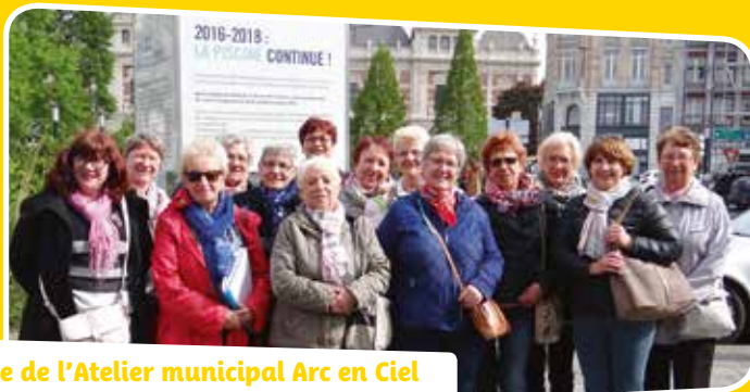
Sortie de l'Atelier municipal Arc en Ciel au musée la Piscine de Roubaix