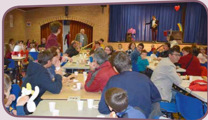
↑ Le spectacle a fait rêver petits et grands.