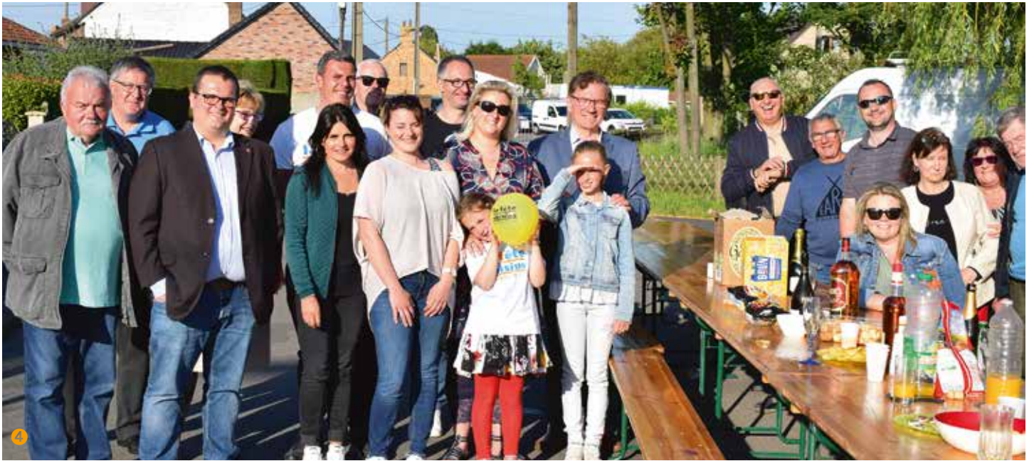
C'est dans une ambiance chaleureuse que les voisins ont pu partager ce moment.