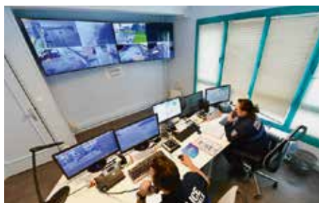
↑ Le centre de supervision de Dunkerque est opérationnel depuis avril.

Vidéo protection / interconnexion du flux des caméras de Fort-Mardyck : Fort-Mardyck dispose d'un parc de caméras opérationnel (bâtiments et voies publics) qui permet de répondre aux nouveaux enjeux de sécurisation. Depuis avril, le basculement des images vers le centre de supervision de Dunkerque est effectif.