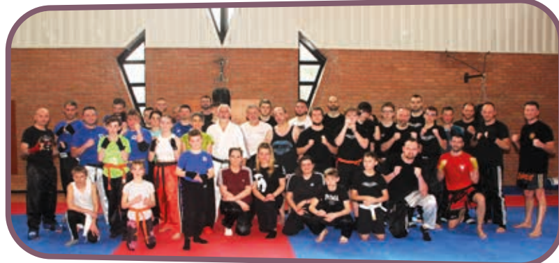
↑ De nombreux participants au stage organisé par le Full Contact.

Journée couronnée de succès : 40 participants parmi lesquels nous comptons nos adhérents mais également des membres des clubs de Watten, Eperlecques et Râches qui ont pu profiter des conseils de nos intervenants. Ce fut une belle expérience que nous pensons renouveler.