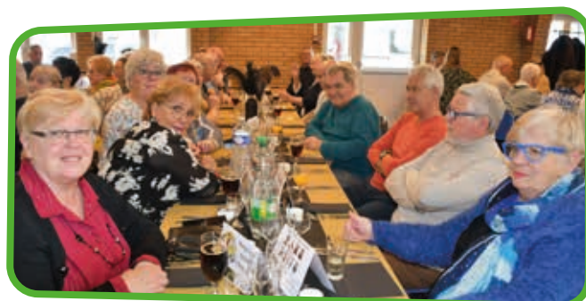
↑ Un moment de convivialité et de retrouvailles pour nos aînés.