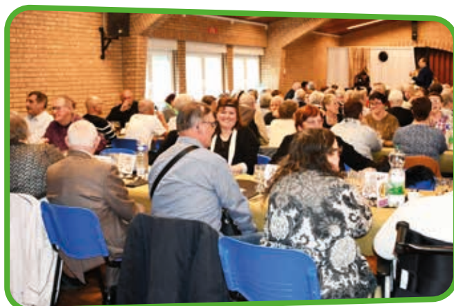
↑ La salle des fêtes était comble pour ce rendez-vous à ne pas manquer !