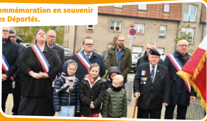
Commémoration en souvenir des Déportés.