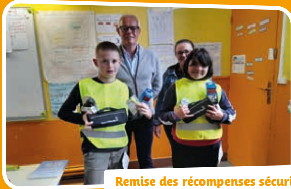
Remise des récompenses sécurité routière aux scolaires.