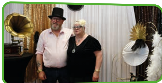
↑ Un bond dans le passé à l'époque des années folles.