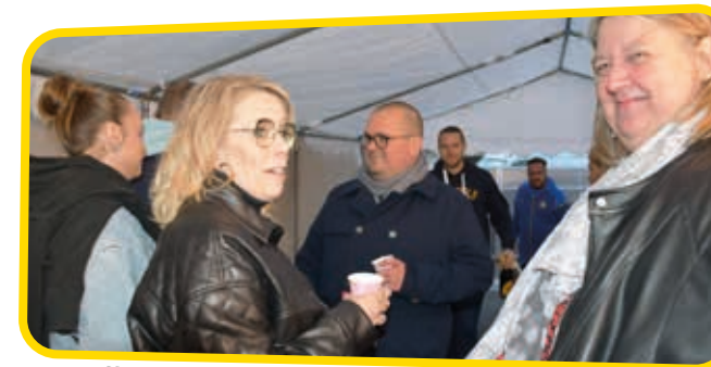
↑ C'est sous une tonnelle que les participants de la rue du Nord ont trouvé refuge.