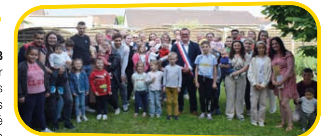
↑ De belles familles à Fort-Mardyck !