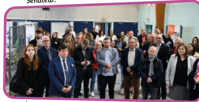
↑ Les recruteurs des PME et TPE étaient à l'honneur de cette 3 ème édition.