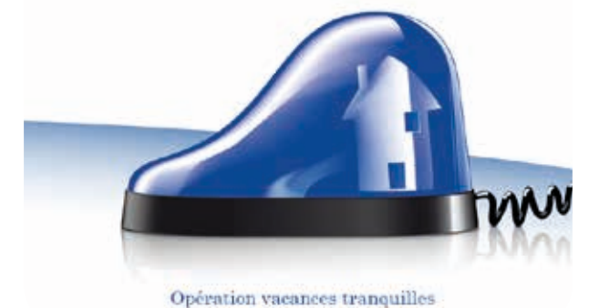
Opération vacances tranquilles

Contre les cambriolages, ayez les bons réflexes !