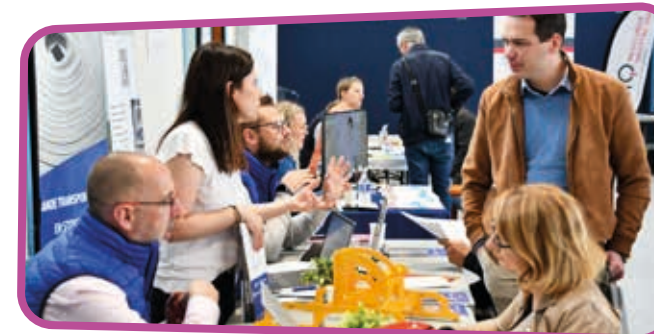
↑ Des rencontres avec des profils intéressants pour les recruteurs.