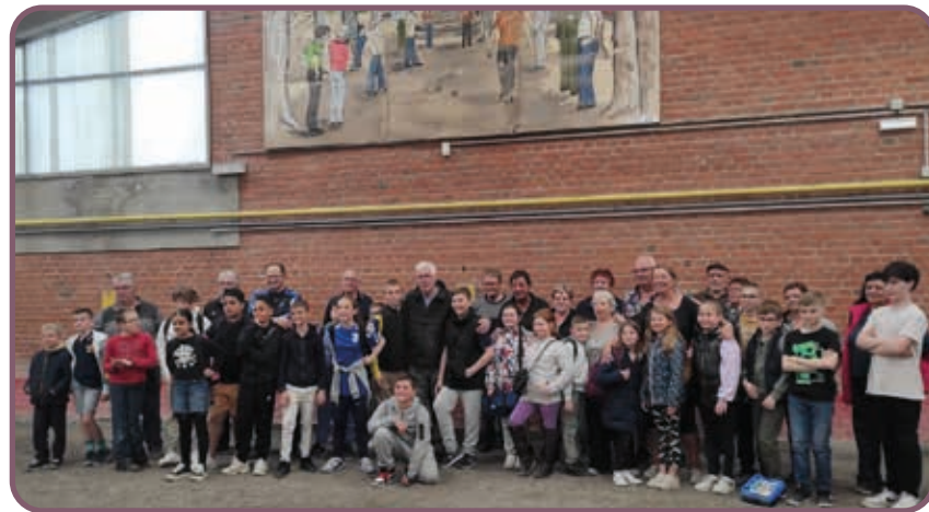
↑ Enfants et adultes ont partagé un très bon moment ensemble !

L'association « Pétanque Fort-Mardyck » a organisé le jeudi 2 mai une rencontre intergénérationnelle avec la participation de 26 enfants fréquentant les ACM de l'AFMACS et leurs accompagnateurs. L'après-midi s'est déroulé dans une ambiance très conviviale avec un moment récréatif lors du goûter offert par l'association organisatrice. Les enfants étaient ravis de cet après-midi bien rempli !