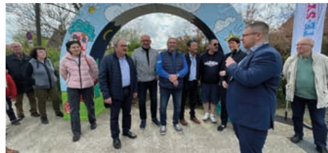
↑ Inauguration de l'arche urbaine rue du banc vert.