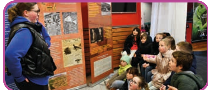
↑ Les services civiques ont fait visiter l'exposition aux élèves du périscolaire et aux séniors.

Cette exposition, à visée itinérante, a été présentée fin mai au collège Jean DECONINCK à Saint-Pol-sur-Mer, au 50 ème anniversaire du CLIC à la Salle des Fêtes, au