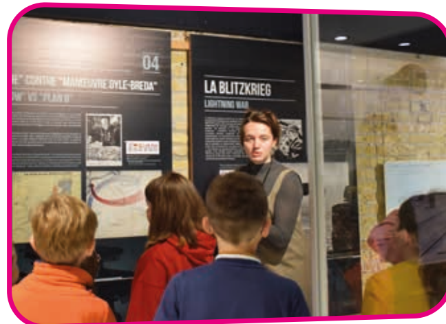
↑ A la rencontre de l'Histoire et de la stratégie militaire.