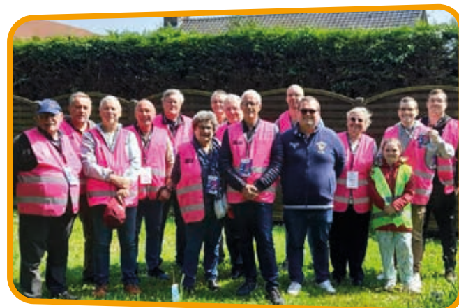
↑ Un grand MERCI à tous les bénévoles qui ont donné de leur temps pour sécuriser les accès.