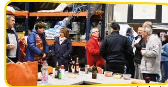
↑ Le soleil n'était pas au rendez-vous rue de l'Amirauté et rue Jules Ferry mais la convivialité oui !