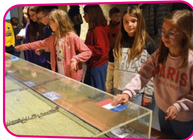
↑ A l'aide des maquettes les CME revivent le Miracle de Dunkerque.

Fruit du travail de passionnés et disposant de matériel d'époque, le Musée Dunkerque 1940 raconte cet événement de notre histoire locale et mondiale qui a changé le cours de la seconde guerre mondiale. Nous vous invitons à le visiter !