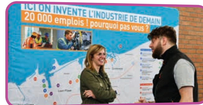
↑ Avec 20 000 emplois à pourvoir sur le territoire, l'avenir du Dunkerquois passe par l'industrie !