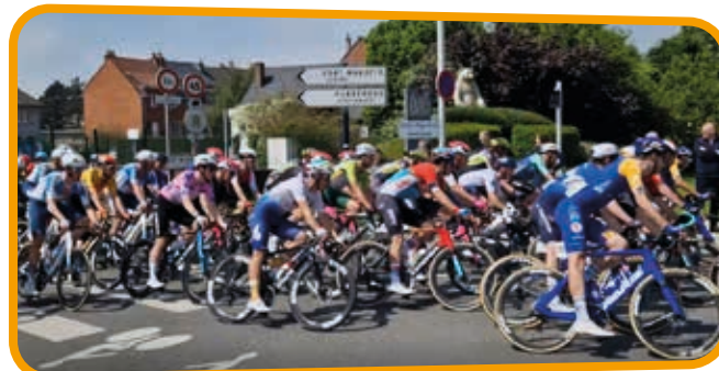
↑ Les coureurs n'ont pas démerité dans cette dernière étape qui a consacré l'Irlandais Sam BENNETT.