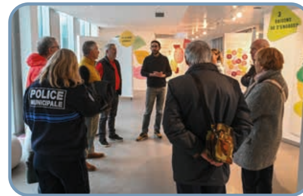
↑ Visite de la Halle aux sucres et échanges autour de l'engagement citoyen.

Le mercredi 27 mars dernier les membres du réseau se sont rendus à la Halle aux sucres pour échanger autour des expositions sur l'engagement citoyen et le sport, ainsi que sur le tri et la valorisation des déchets. Un bon moyen d'en apprendre plus. C'est aussi faire de son engagement citoyen, un moment de partage de connaissances !