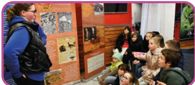
↑ Les services civiques ont fait visiter l'exposition aux élèves du périscolaire et aux séniors.

Cette exposition, à visée itinérante, a été présentée fin mai au collège Jean DECONINCK à Saint-Pol-sur-Mer, au 50 ème anniversaire du CLIC à la Salle des Fêtes, au