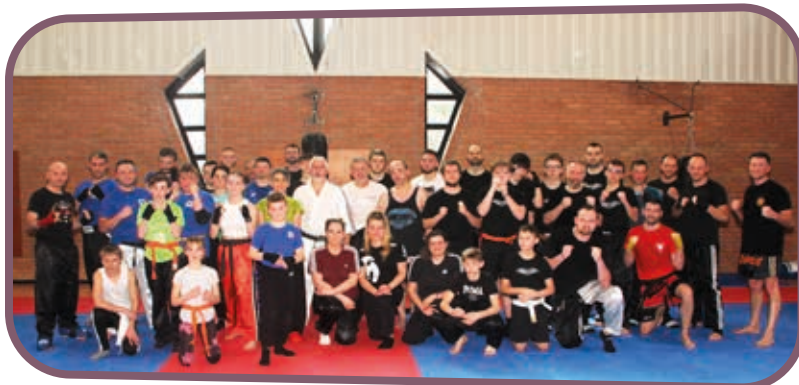
↑ De nombreux participants au stage organisé par le Full Contact.

Journée couronnée de succès : 40 participants parmi lesquels nous comptons nos adhérents mais également des membres des clubs de Watten, Eperlecques et Râches qui ont pu profiter des conseils de nos intervenants. Ce fut une belle expérience que nous pensons renouveler.