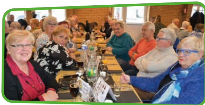
↑ Un moment de convivialité et de retrouvailles pour nos aînés.