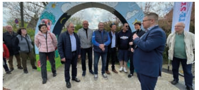
↑ Inauguration de l'arche urbaine rue du banc vert.