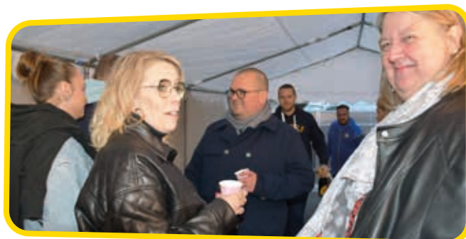
↑ C'est sous une tonnelle que les participants de la rue du Nord ont trouvé refuge.