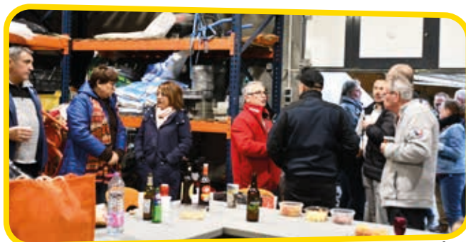
↑ Le soleil n'était pas au rendez-vous rue de l'Amirauté et rue Jules Ferry mais la convivialité oui !