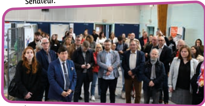
↑ Les recruteurs des PME et TPE étaient à l'honneur de cette 3 ème édition.