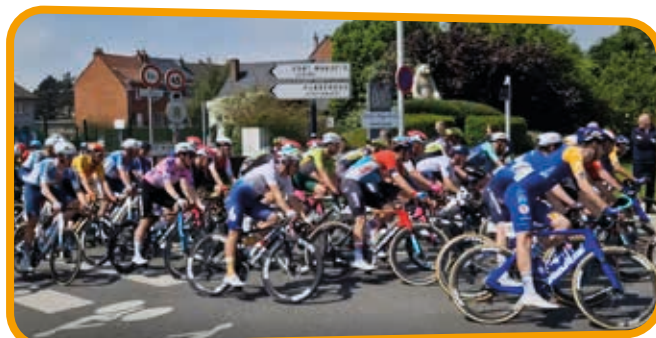
↑ Les coureurs n'ont pas démerité dans cette dernière étape qui a consacré l'Irlandais Sam BENNETT.