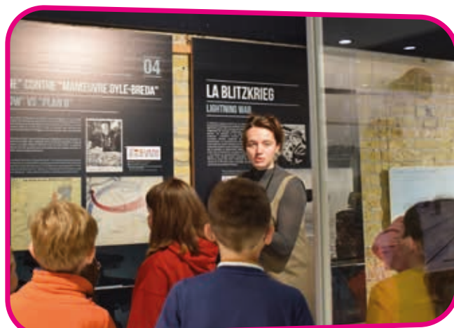
↑ A la rencontre de l'Histoire et de la stratégie militaire.