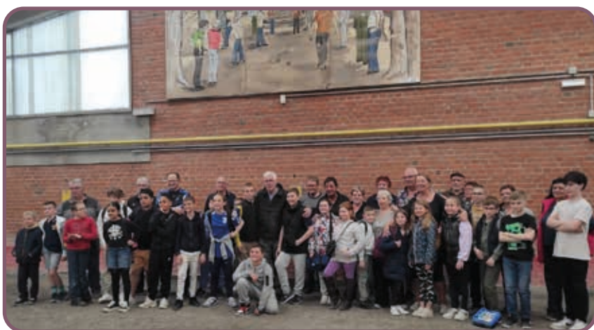
↑ Enfants et adultes ont partagé un très bon moment ensemble !

L'association « Pétanque Fort-Mardyck » a organisé le jeudi 2 mai une rencontre intergénérationnelle avec la participation de 26 enfants fréquentant les ACM de l'AFMACS et leurs accompagnateurs. L'après-midi s'est déroulé dans une ambiance très conviviale avec un moment récréatif lors du goûter offert par l'association organisatrice. Les enfants étaient ravis de cet après-midi bien rempli !