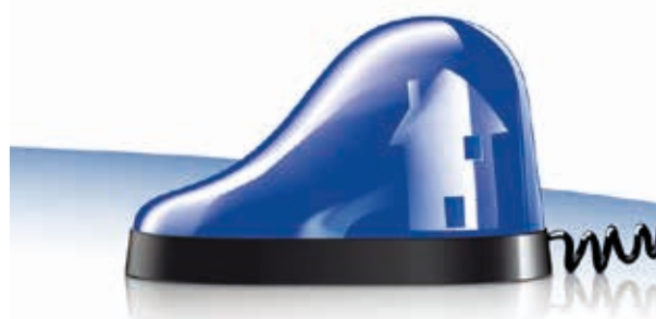
Opération vacances tranquilles

Contre les cambriolages, ayez les bons réflexes !