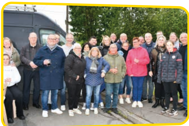
↑ Rue du Flot Moulin, les courageux voisins se sont rassemblés à l'extérieur malgré la fraîcheur.