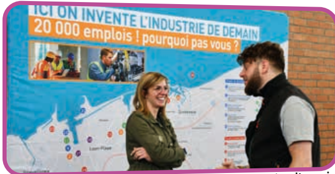
↑ Avec 20 000 emplois à pourvoir sur le territoire, l'avenir du Dunkerquois passe par l'industrie !