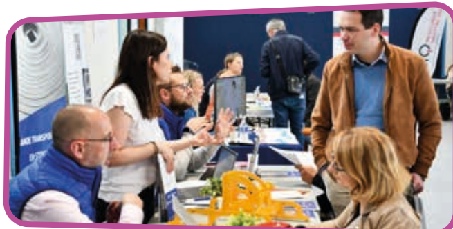
↑ Des rencontres avec des profils intéressants pour les recruteurs.