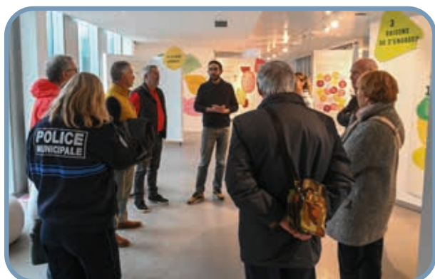
↑ Visite de la Halle aux sucres et échanges autour de l'engagement citoyen.

Le mercredi 27 mars dernier les membres du réseau se sont rendus à la Halle aux sucres pour échanger autour des expositions sur l'engagement citoyen et le sport, ainsi que sur le tri et la valorisation des déchets. Un bon moyen d'en apprendre plus. C'est aussi faire de son engagement citoyen, un moment de partage de connaissances !